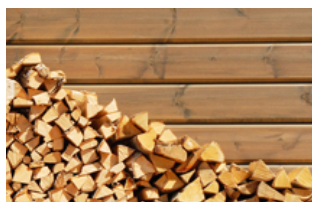
Valtti Wood Finishes spalvų paletė