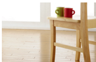
Interior Lacquer spalvų paletė

Tonuojant pasirinktą spalvą , dažų indelis įdedamas į tonavimo pastų dozavimo aparatą, o pasirinktas spalvos kodas įvedamas į kompiuterį. Aparatas dažams dozuoja skirtingą kiekį ir skirtingo tipo dozavimo pastos laikydamosi nurodytos receptūros. Supylus tonavimo pastas, dažų indelis talpinamas į plaktuvą, kuriame tonavimo pasta ir dažai gerai išmaišomi.