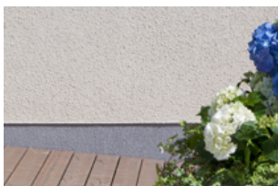
Facade spalvų paletė